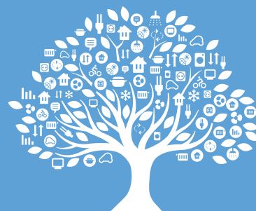
EKIPA PROJEKTA "INICIATIVA ENERGIJA SI"